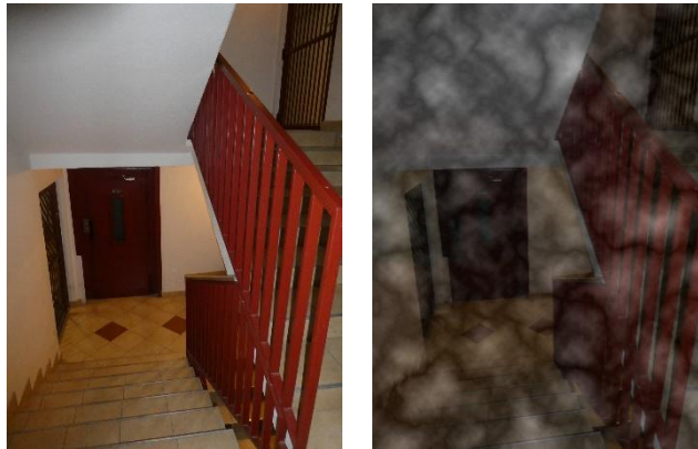
1. kép: Menekülési útvonal, a keletkező füst látást korlátozó hatása