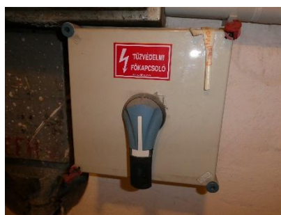
5. kép: Az épület tűzeseti főkapcsolója