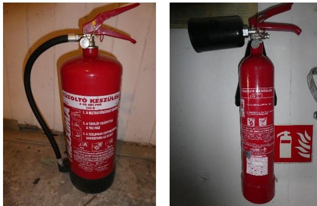
3. kép: Hordozható tűzoltó készülékek különböző típusai