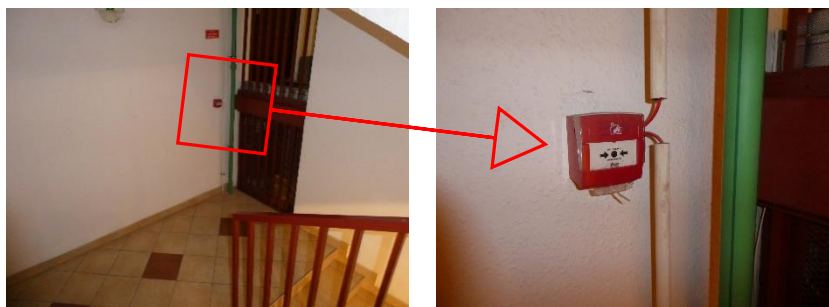
2. kép: Hő- és füstelvezetést, menekülést biztosító távnyitó